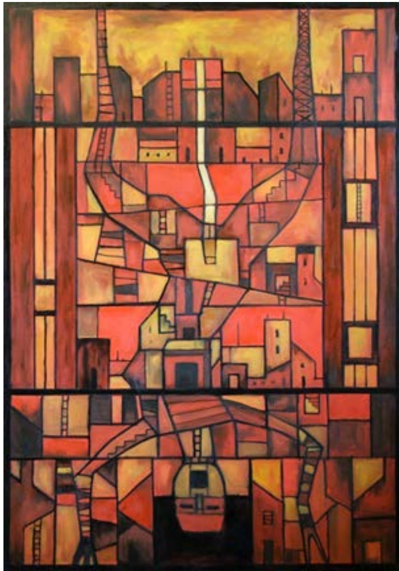
Földalatti város 1. olaj, vászon, 100 x 70 cm, 2017