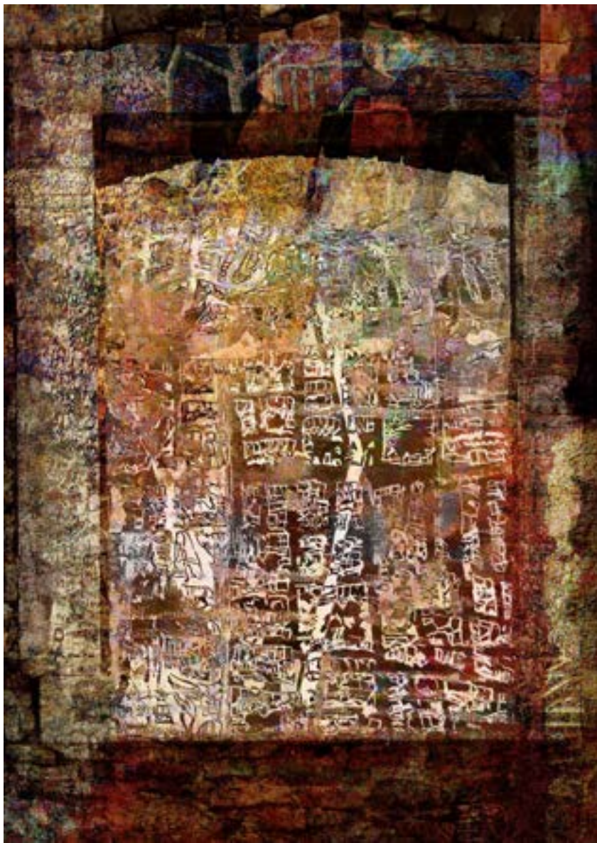
Távolodás, elektrofestmény, 100 x 70 cm 2018