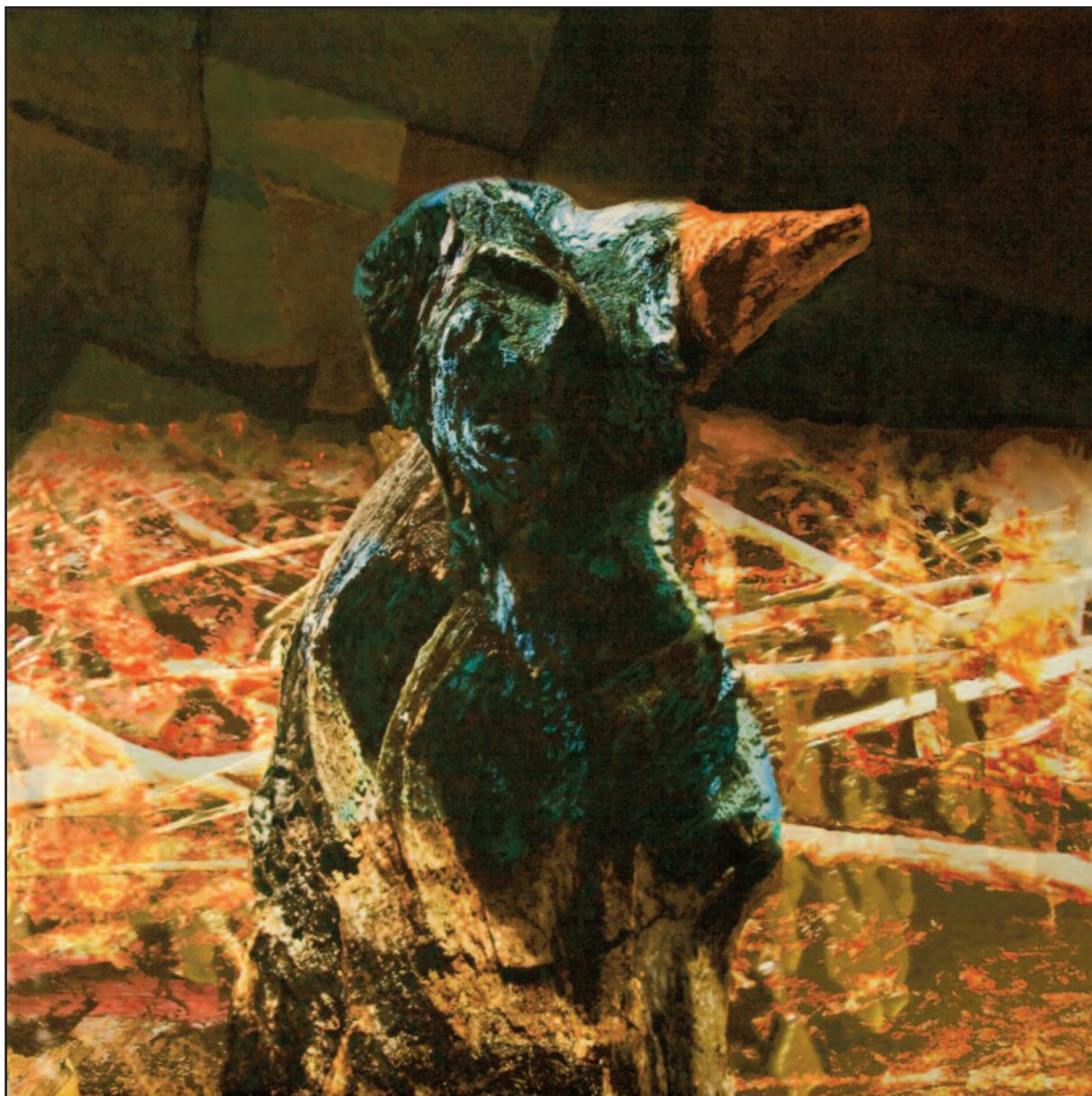
Fészek, 2009–2010. akryl, vegyes technika, vászon, 120x120 cm