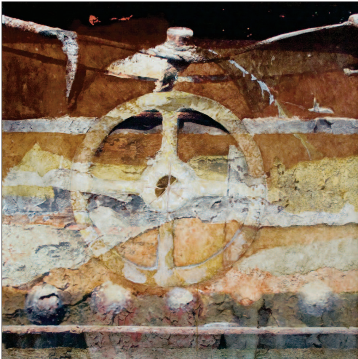
Asóka kereke, 2009–2010. akryl, vegyes technika, vászon, 120x120 cm