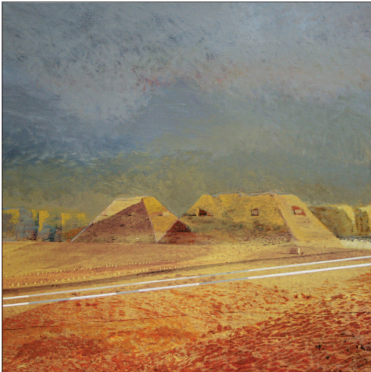
Egyiptom II, 2010. akryl, vegyes technika, vászon, 120x120 cm