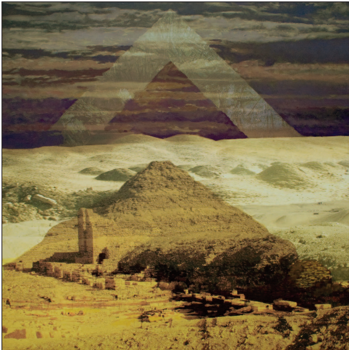
Egyiptom I, 2010. akryl, vegyes technika, vászon, 120x120 cm