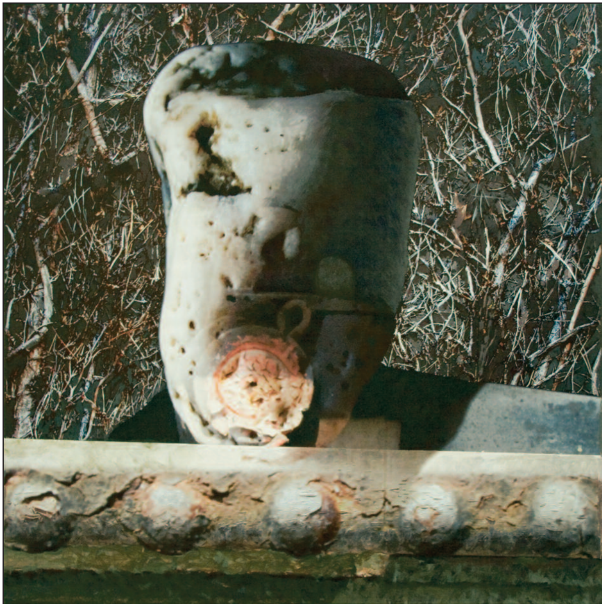
Vadság, 2009–2010. akril, vegyes technika, vászon, 120x120 cm