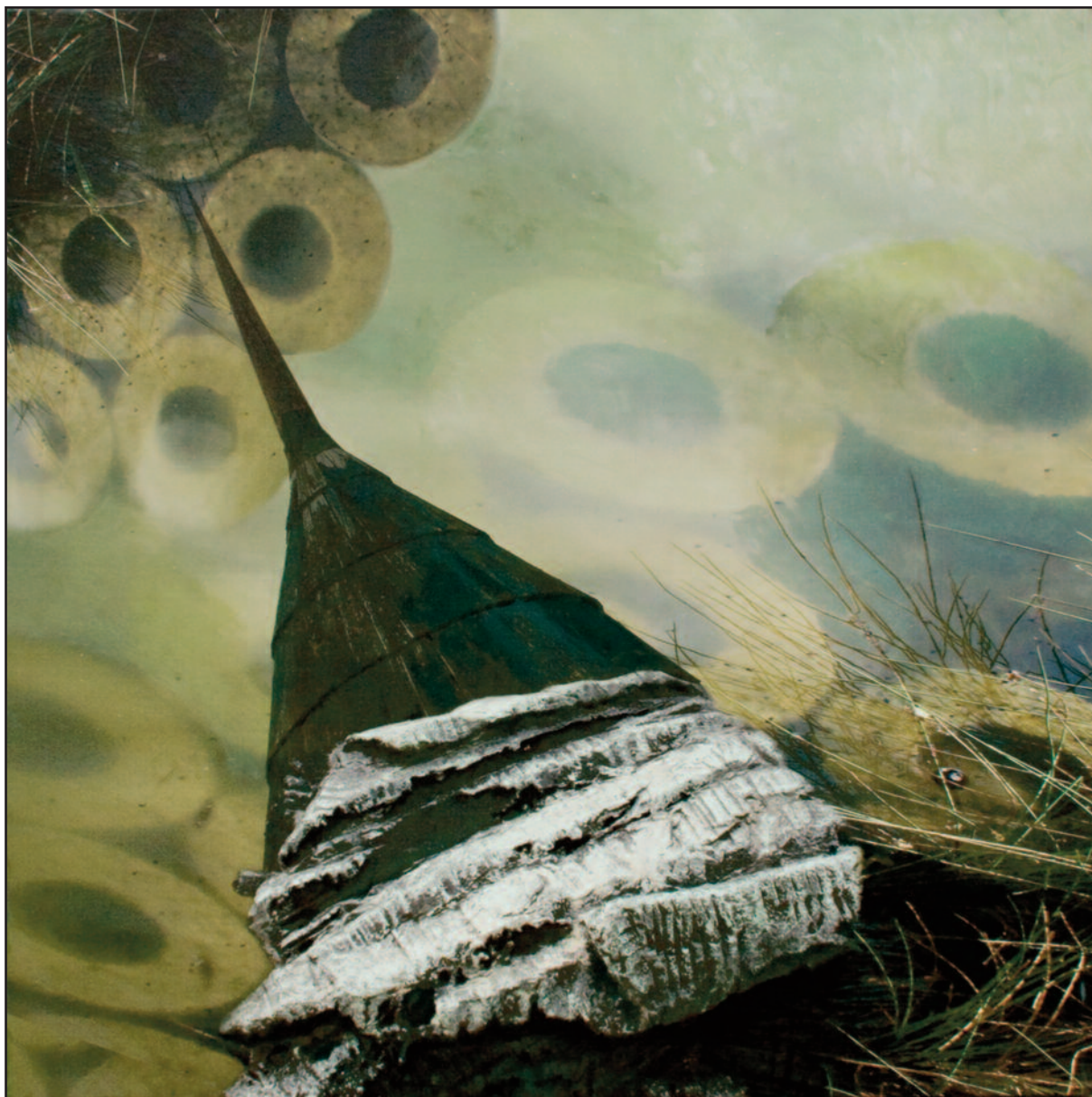
Víz alatt, 2009–2010. akril, vegyes technika, vászon, 120x120 cm