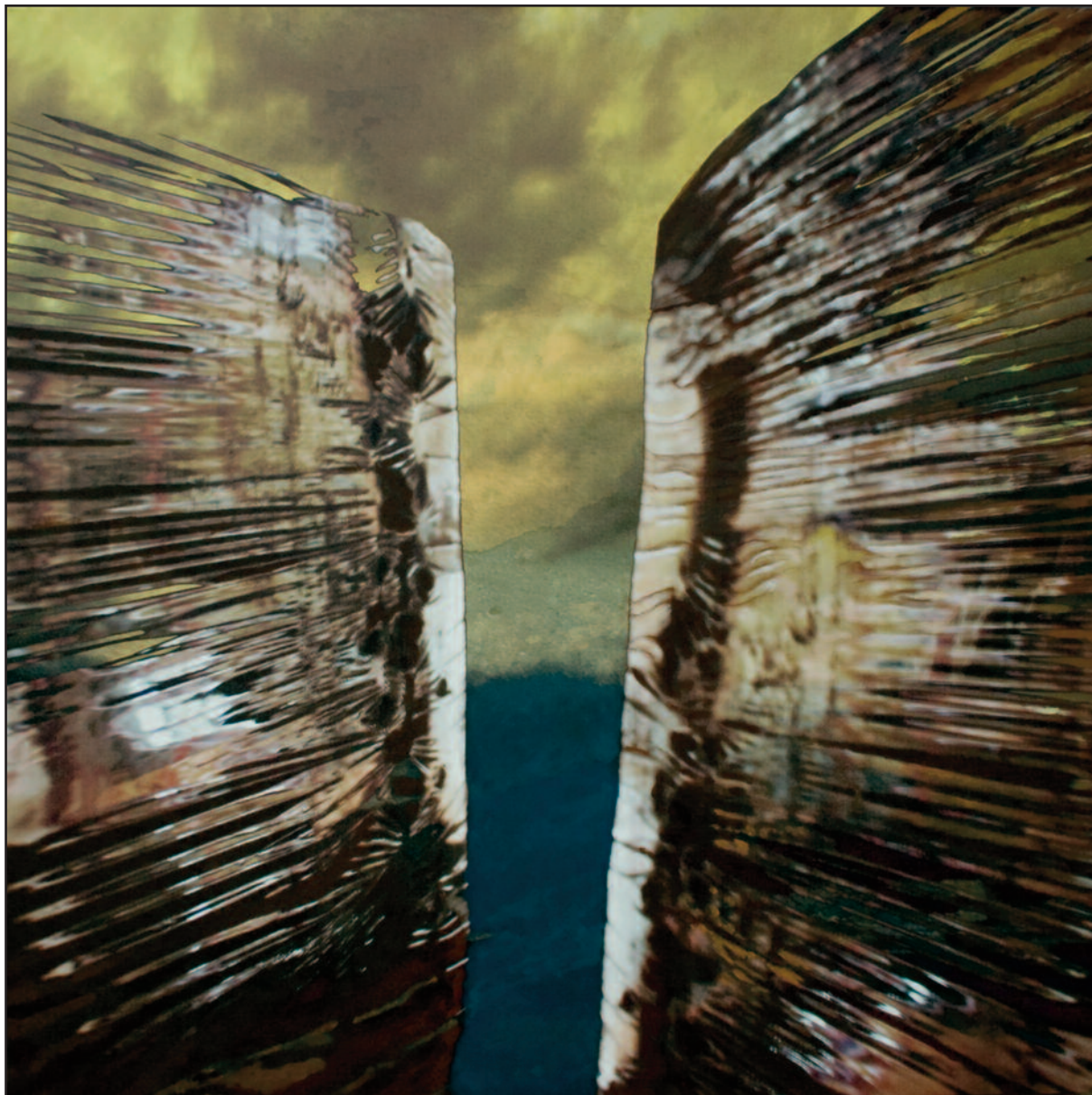
Kapu, 2009–2010. akril, vegyes technika, vászon, 120x120 cm