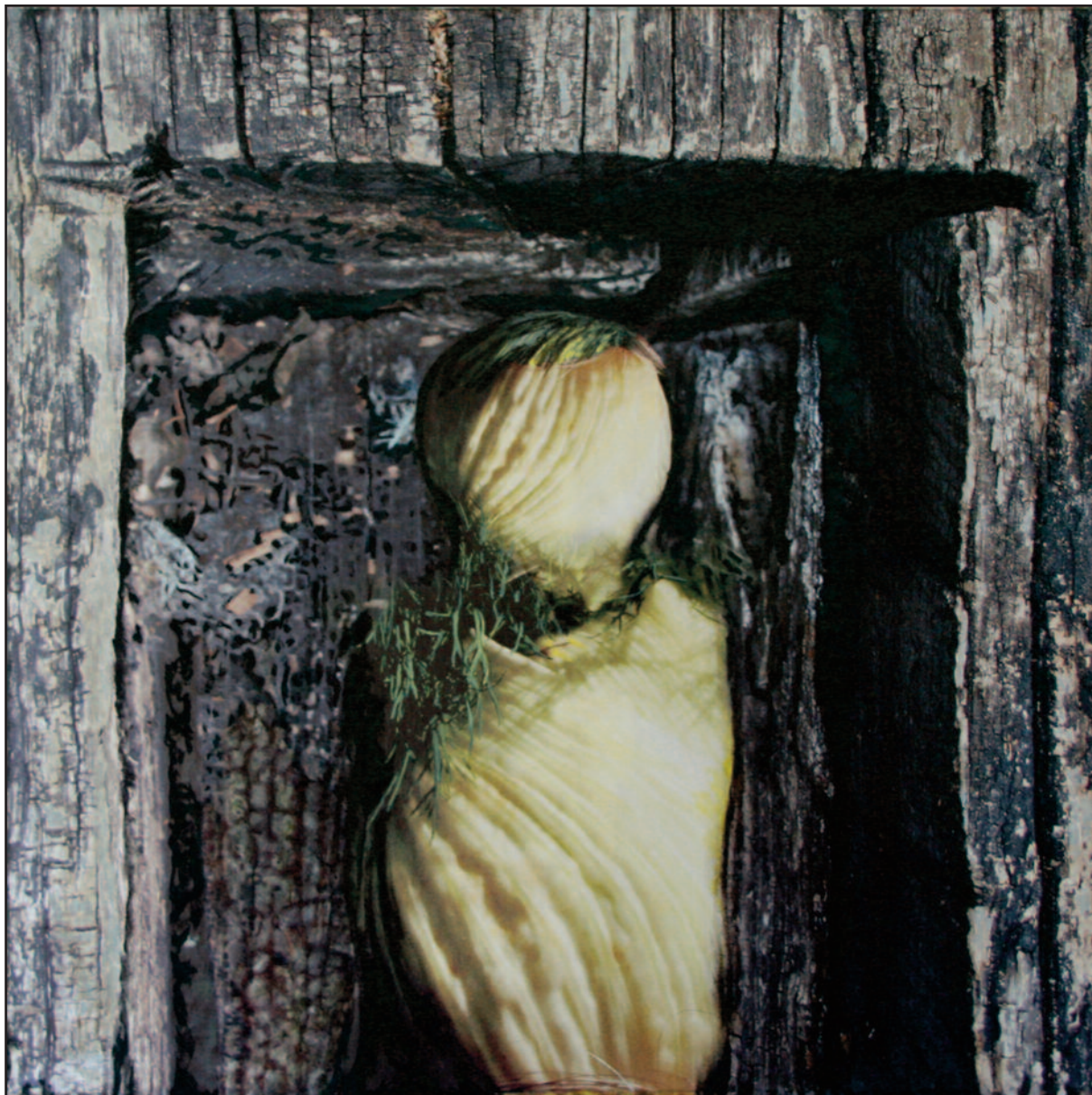
Kapuban, 2009–2010. akryl, vegyes technika, vászon, 120x120 cm