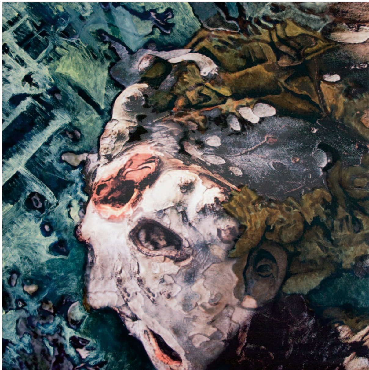
Fejlövés, 2009–2010. akryl, vegyes technika, vászon, 120x120 cm