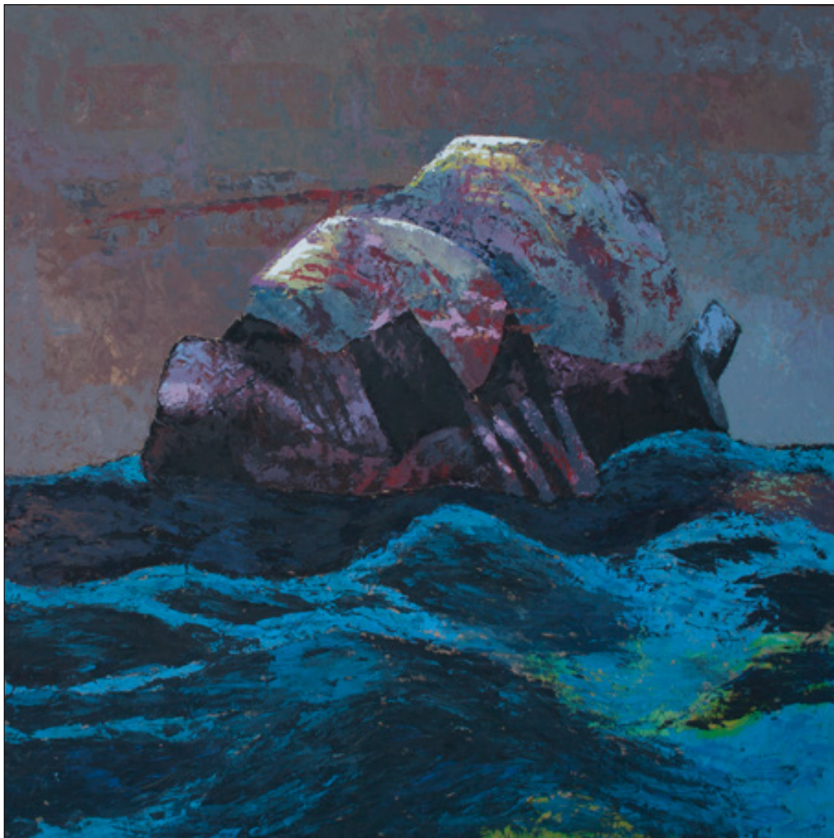
Charon holt lelket visz át a Styx folyón , 2015. 100x100 cm akryl, farost