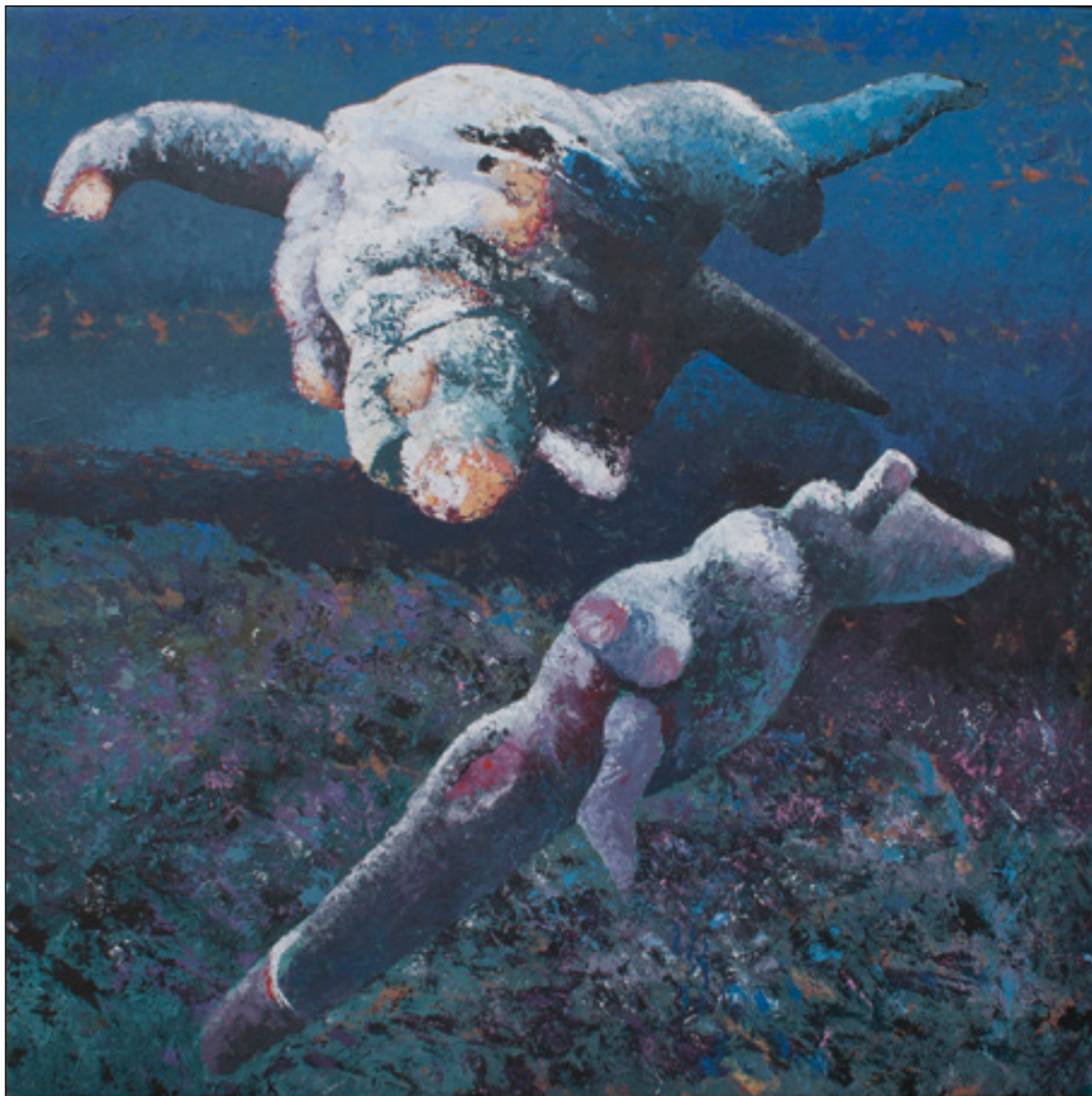
Anyaság , 2016. 120x120 cm akryl, vászon