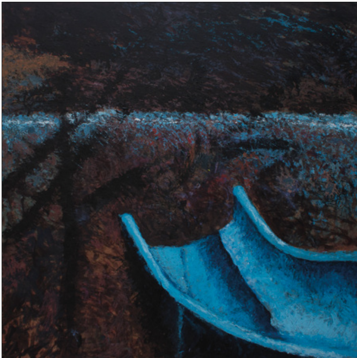
Rókacsúszda , 2013. 100x100 cm akryl, farost