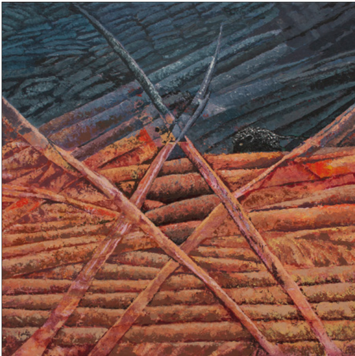
Dimenzió eltolódás , 2015. 130x130 cm akryl, vászon