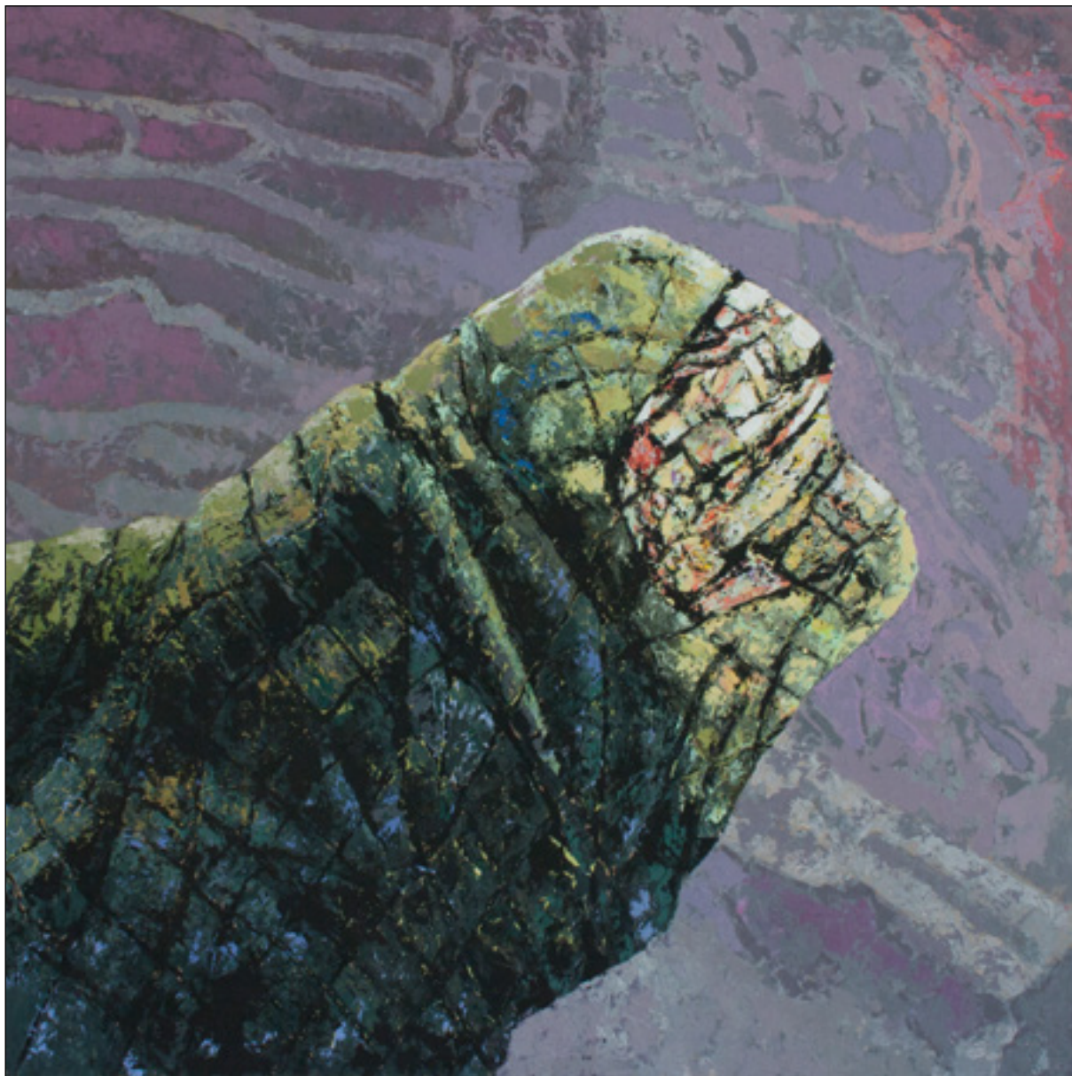
Vágy , 2015–16. 100x100 cm akryl, farost