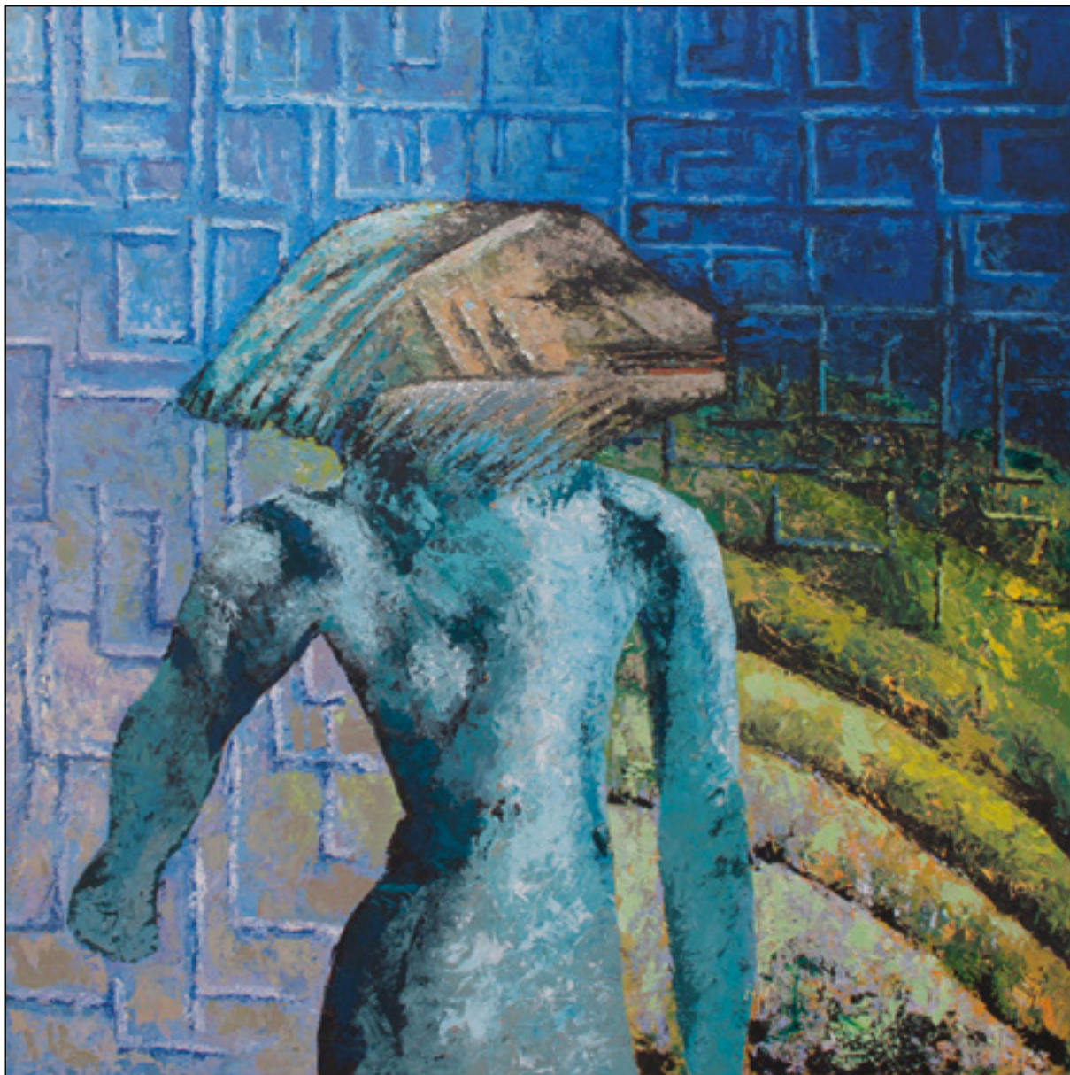
Labirintus , 2014. 100x100 cm akryl, farost