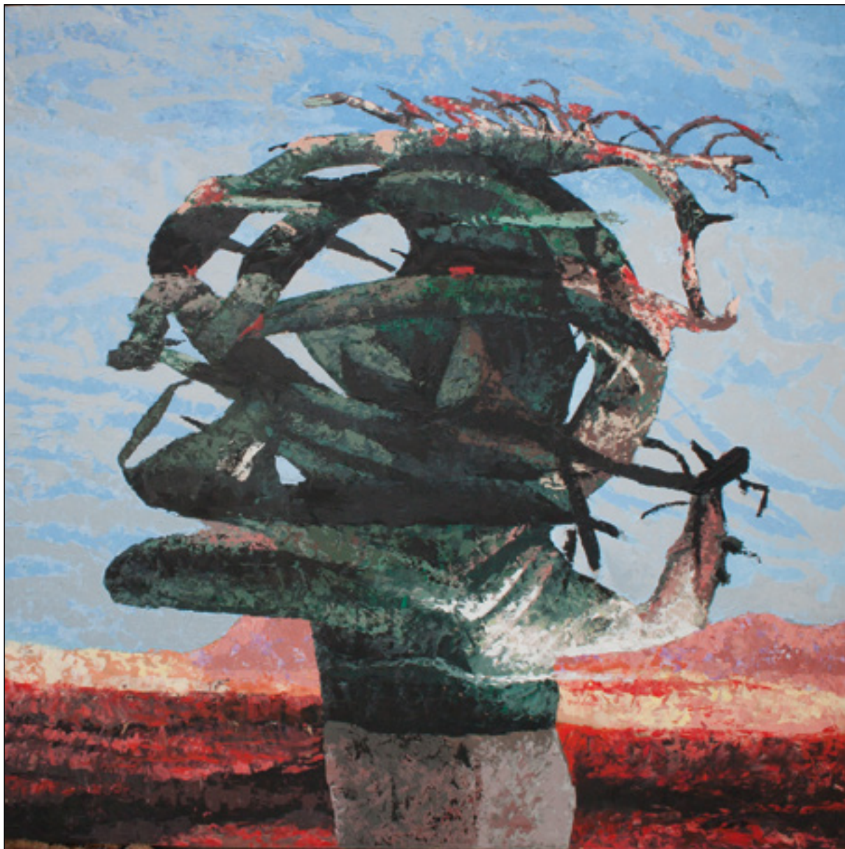
Időhurok , 2015. 100x100 cm akryl, farost