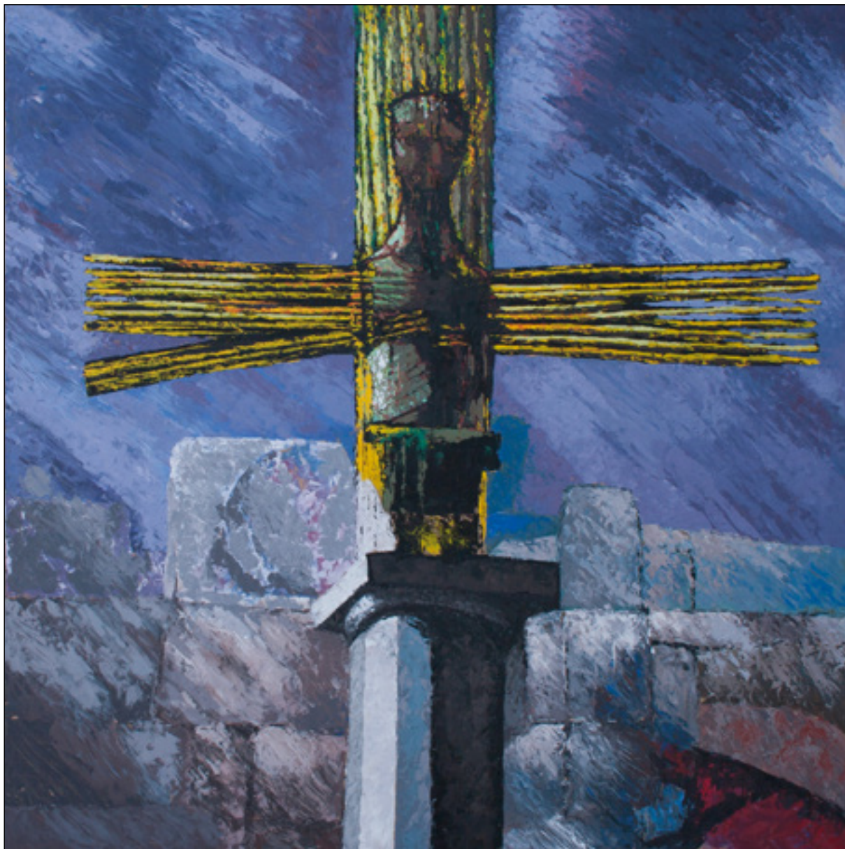
Szalmakrisztus , 2015. 100x100 cm akryl, farost