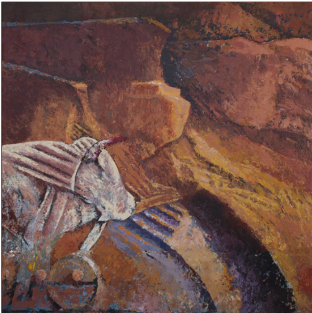
Sumér történet , 2014–16. 100x100 cm akryl, vászon