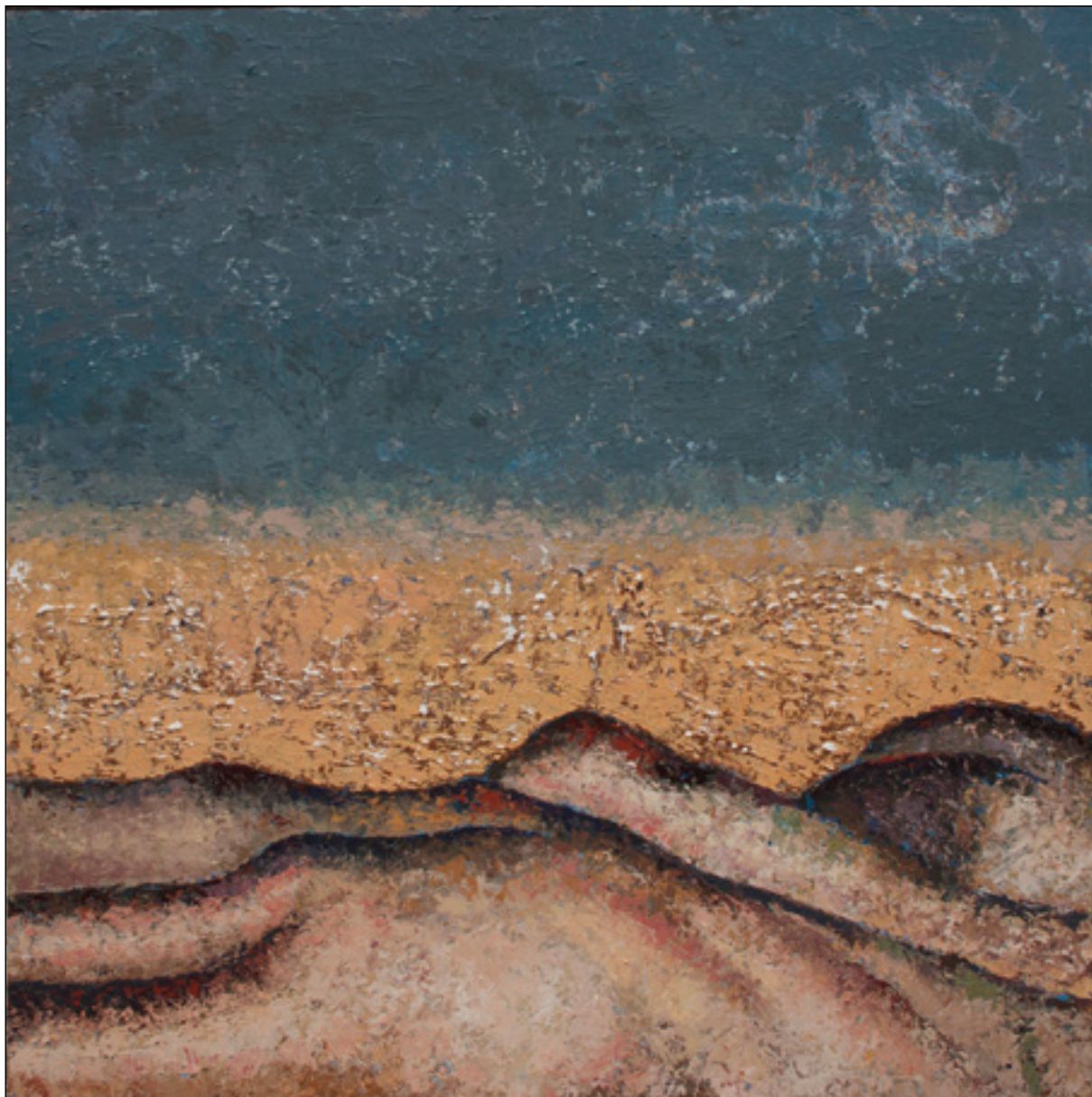
Tengerpart , 2014. 100x100 cm akryl, farost