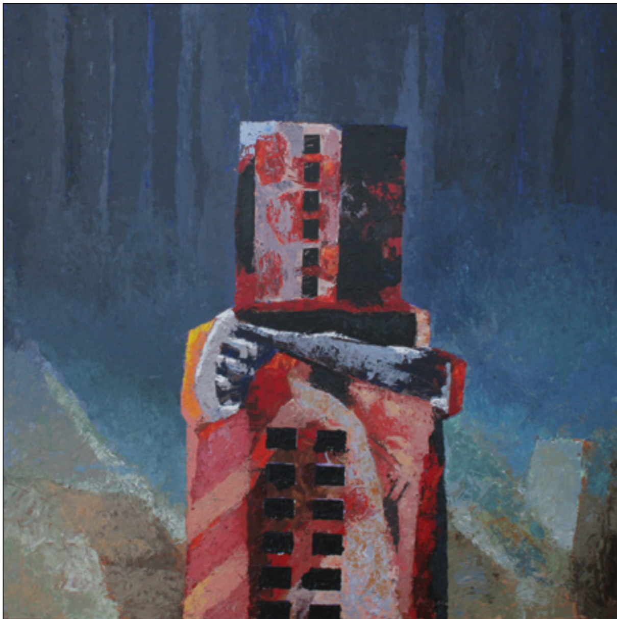
A torony , 2013. 100x100 cm akryl, farost