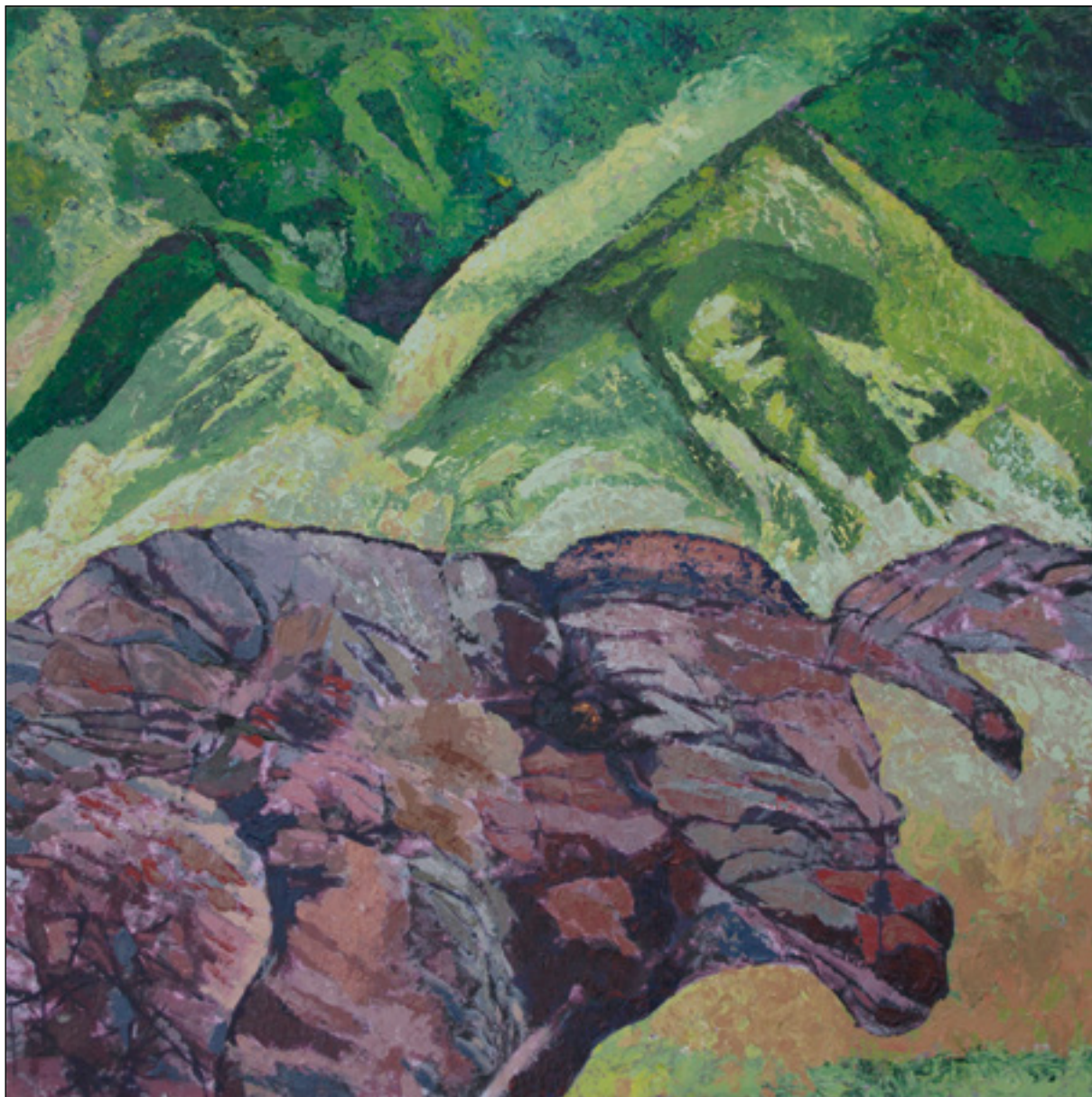
Vadászat , 2014. 100x100 cm akryl, farost