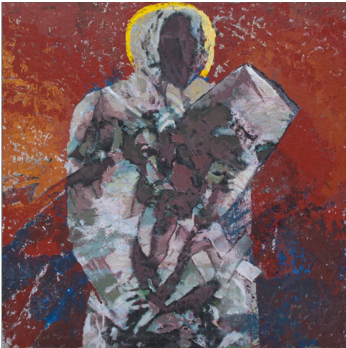
Az idegen , 2014. 100x100 cm akryl, farost